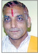
आशीर्वाद और अच्छे भाग्य के लिए आदर्श माना जाता है।

में पूजा करता है उसको भगवान शिव से कई गुना फल की प्राप्ति होती है। उन्होंने