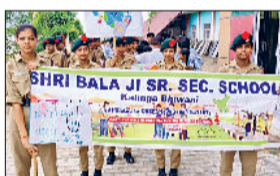
भिवानी। जागरूकता रैली निकालते एनसीसी कैडेट्स।