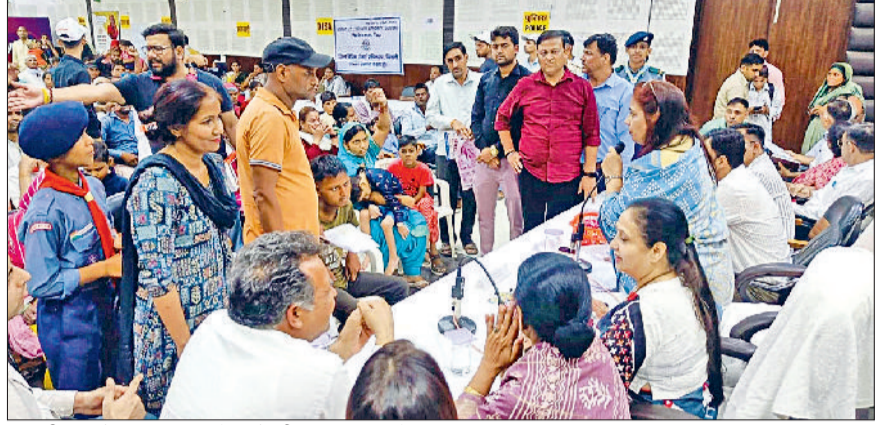
भिवानी। आयोजित कार्यक्रम में बच्चों की समस्याएं सुनते हुए।