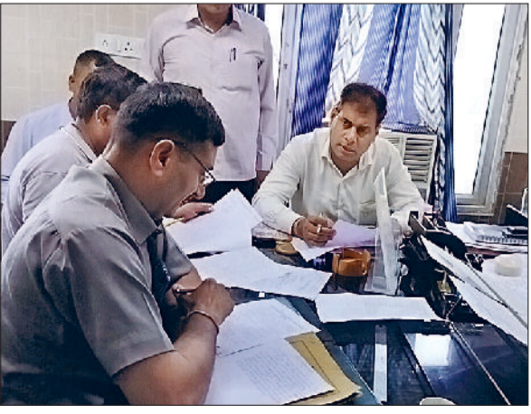
भिवानी। छापे के दौरान कागजातों की जांच करते हुए।

दक्षिण हरियाणा बिजली वितरण निगम कार्यालय पर सीएम फ्लाइंग ने आज छापेमारी करते हुए विभाग की कार्यप्रणाली की जांच के लिए डॉक्यूमेंट अपने कब्जे में लिए। सीएम फ्लाइंग दोपहर को अचानक आकषिप्त किया तथा जनसंख्या वृद्धि के बारे में चर्चा शुरू हो गयी। यही कारण है कि 11 जुलाई को पांच अरब का दिन के रूप में जाना जाने लगा। इस आयोजन की रचि ने जनसंख्या संबंधी मुद्दों के समाधान के लिए एक समर्पित मंच की आवश्यकता पर प्रकाश डाला।