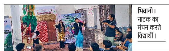
भिवानी। नाटक का मंचन करते विद्यार्थी।