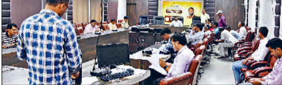
भिवानी। समाधान शिविर में लोगों की समस्याओं का समाधान करते हुए।