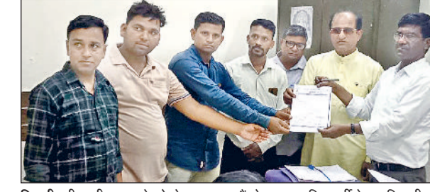
भिवानी। नीट परीक्षा मामले को लेकर ज्ञान सौपते बहुजन मुक्ति पार्टी के पदाधिकारी।