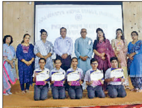
भिवानी। विजेताओं को पुरस्कृत करते अतिथि।